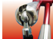
不銹鋼整體球形上關節