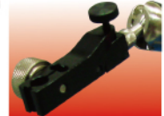
精密型穩固微調裝置