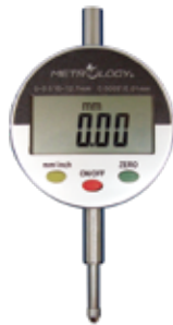
ED-9010 ED-9025 ED-9050