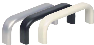
MF · MF-CLEAN