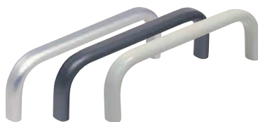
OA · OA-CLEAN