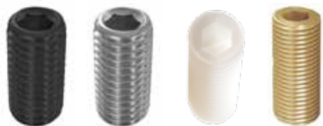
PSW PSSW PSWP SCFPK