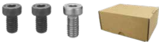
EBS EBSH EBSST