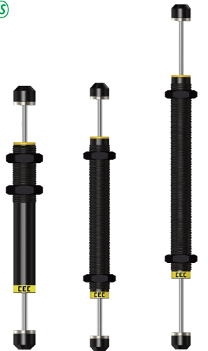
SCD2030 SCD2035 SCD2050