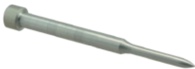
前端形狀的外觀因P尺寸而異