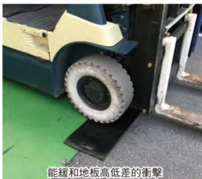
能緩和地板高低差的衝擊