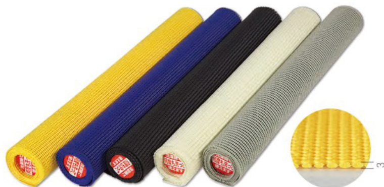
TCB-TM-01 TCB-TM-02 TCB-TM-04 TCB-TM-05 TCB-TM-09