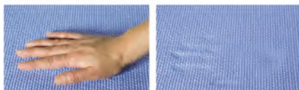
適度緩衝、高柔軟彈性材質