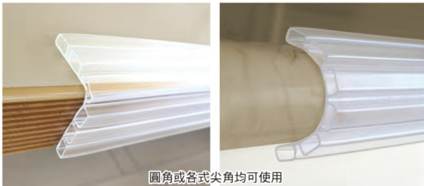
圓角或各式尖角均可使用