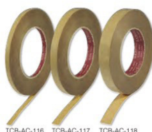
TCB-AC-116 TCB-AC-117 TCB-AC-118