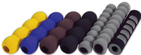
TCB-GG-01 TCB-GG-02 TCB-GG-03 TCB-GG-04 TCB-GG-05 TCB-GG-06 TCB-GG-07