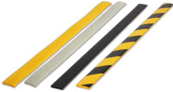
TCB-AC-33 TCB-AC-34 TCB-AC-112 TCB-AC-115