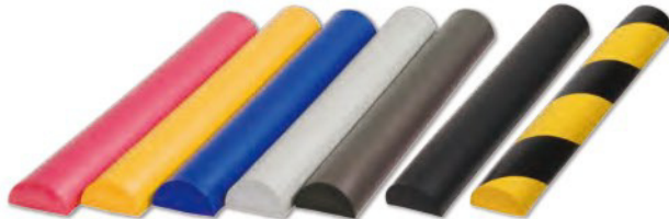
左起：TCB-AC-39 TCB-AC-40 TCB-AC-41 TCB-AC-42 TCB-AC-43 TCB-AC-110 TCB-AC-113