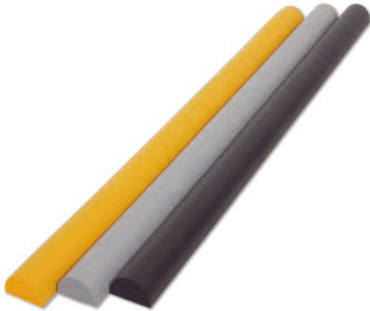
左起：TCB-AC-146 TCB-AC-147 TCB-AC-148