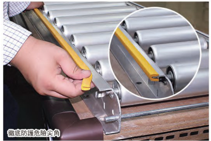
徹底防護危險尖角