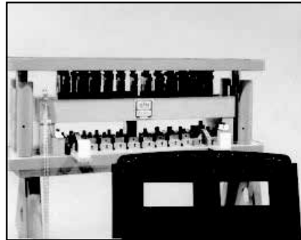
Tog-L-Loc 使用於汽車頂板壓合