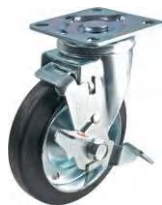
STC-150 CBC S-2

▶▶ STC 自在 S-2ストッパー 100-150mm / S-2ストッパーは車輪の回転を止めるストッパーです。