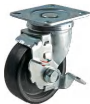
STC-100 GNU S-2