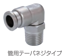
管用テーパネジタイプ