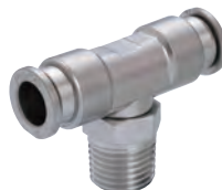
管用テーバネジタイプ