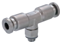
メートルネジタイプ